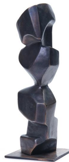
one artist room

Selbstportrait II Bronze Martin Amerbauer