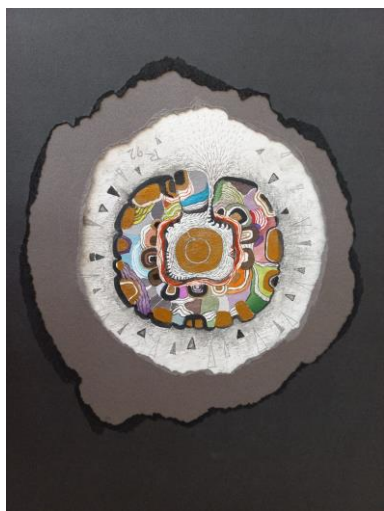
Up-cycling im Atelier

Führung durch die Ausstellung mit Marlene Schaumberger